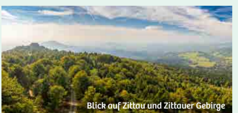
Blick auf Zittau und Zittauer Gebirge

Wenn die Urlaubsunsch- Palette so breit gefächert ist, dass hohe Berge und glitzernde Seen, pulsierende Städte und materische Orte, kurze Wege und weite Fernsichten, aktive Touren und entspannte Momente, kunterbunte Action und anspruchsvolle Kultur nicht zu einem einzigen Urlaubsziel zu passen scheinen, ist die Oberlausitz der perfekte Tipp!