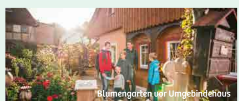
Blumengärten vor Umgebindehaus

schlagader des Wanderwegenetzes ist der prämierte Oberlausitzer Bergweg. Glitzernde Gewässer locken zum Naturgenuss im, am und auf dem Wasser. Wer den Adrenalin such, kann Mountainbiken, Kitesurfen oder Klettern ausüben. Die Freizeitknüller organisieren göngährig Spiel, Spaß, Spannung für Groß und Klein und kinderfreundliche Wanderwege bieten Naturgenuss mit Entdeckungen. In den mittelalterlich-romantischen Städten wie Bautzen und Görlitz verschmelzen Geschichte, Architektur,