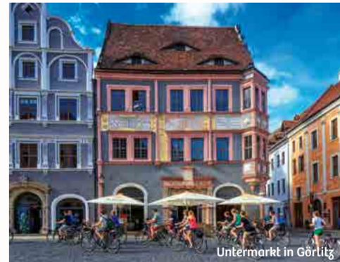
Untermarkt in Görlitz

Görlitz steckt voller Rätsel und Mysterien. Hier scheint jedes Gebäude eine Geschichte erzählen zu können. Manche davon haben mit den unglücklichen Sagen und Anekdoten zu tun, die man hier seit Jahrhunderten von Generation zu Generation weiterreicht. Ihnen als Besucher verrät die Stadt gern ihre Geheimnisse. Zum Beispiel warum die Glocken der Dreifaltigkeitskirche immer sieben Minuten früher schlugen. Oder das Geheimnis des Flüsterbogens. Vielleicht erfahren Sie auch, wie Görlitz zum erfolgreichen Städtedouble Hollywood wurde. Möglicherweise finden Sie auch heraus,