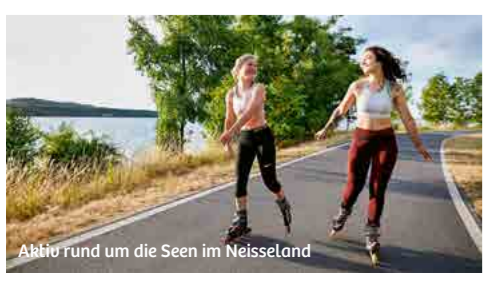
Abbie Fund um die Seen im Neisse-land

Zwischen dem UNESCO Welterbe Muskauer Park in Bad Muskau und dem Bergdorfer See bei Görlitz erstreckt sich das Neisse-land, welches sich vor allem durch abwechslungsreiche Naturlandschaften, und spannende Sehenswürdigkeiten auszeichnet. Auf engstem Raum können hier gleich drei Highlights mit UNESCO – Titel besucht werden. Neben dem deutsch-polnischem UNESCO Welterbe Muskauer Park, kann man im UNESCO Global Geopark Muskau-