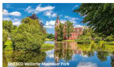
UNESCO Welterbe Muskauer Park

Am Besten erkundet man das NEISSELAND mit dem Rad. Ein dichtes Radwegenetz mit abwechslungsreichen Touren führt durch die flache, teils hügelige Region, vorbei an vielen kleinen und großen Sehenswürdigkeiten. Entlang des Oder-Neißé-Radweges, des Froschradweges oder der Neisse-land-Tour prägen riesige Wälder, zahlreiche Seen und Teiche sowie wunderschöne Park- und Gartenanlagen die Landschaft. Viel Wissenswertes über die Traditionen, die Kultur und das Leben der Sorben vermitteln der Radweg „Sorbische Impressionen“ und das Sorbische Kulturzentrum Schleife.